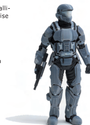
Exemple imprimé avec un système CONNEX (bi-matière)