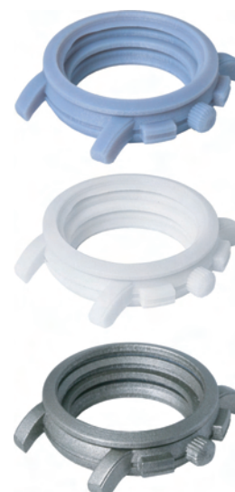
Design: Paul Picot

Délai de livraison très court (dès 48 H selon l'objet et notre planning)