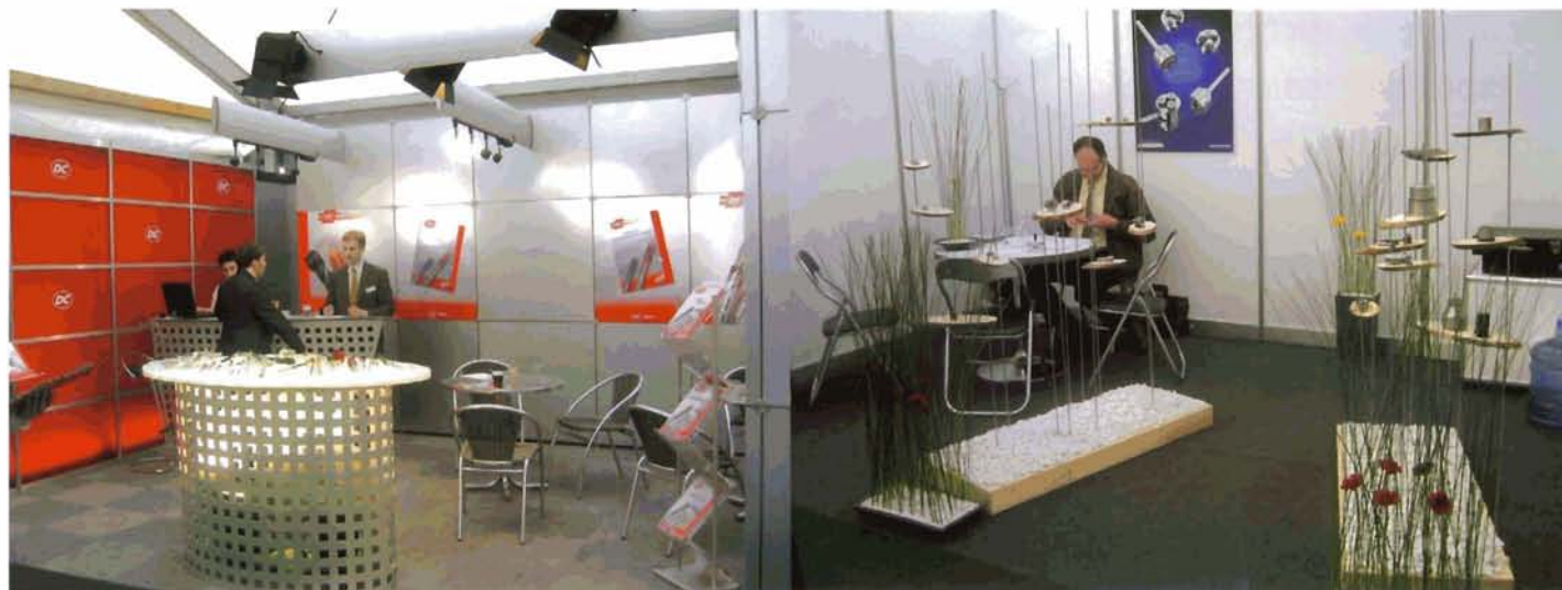
SIAMS 2004: les stands de DC Swiss S.A. et de Habegger S.A.

Selon l'entreprise Habegger, ces sociétés pionnières jugeaient essentiel de se présenter à leurs clients communs dans une ambiance avant tout conviviale. 19 ans plus tard, ces premières valeurs font-elles toujours partie d'arguments avancés par les exposants?