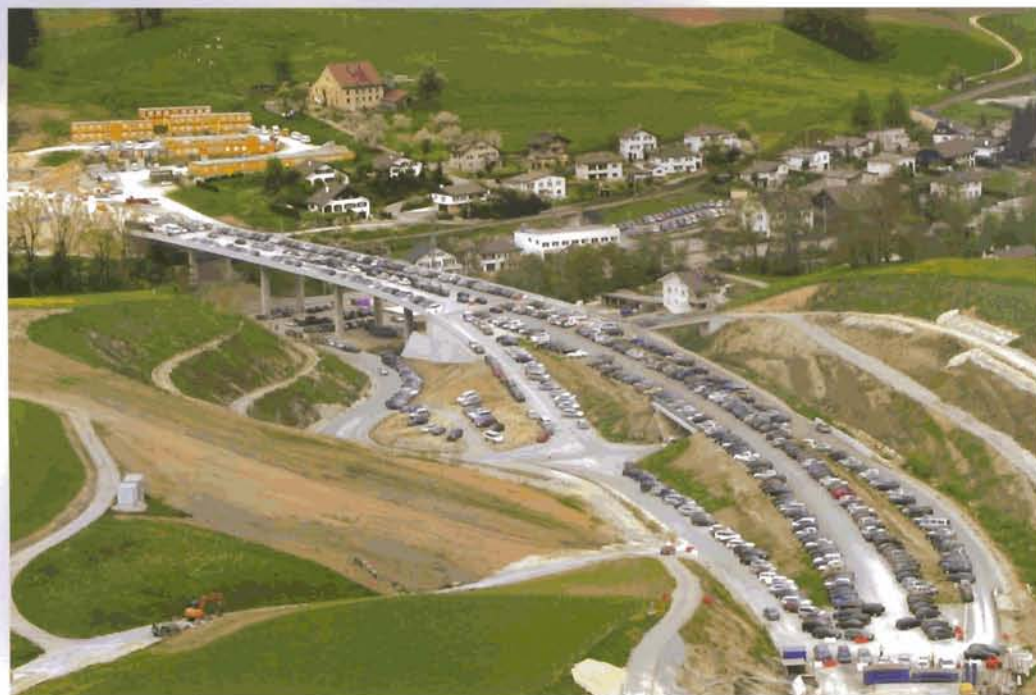
Parking du SIAMS: une bretelle d'autoroute non encore en service...